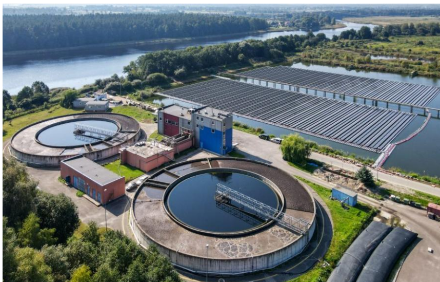
Foto: päikeseenergiajaam Sloka reoveepuhastusjaamas.

Näitajad: paigaldatud taastuenergialahenduste arv (tk), LED-valgustite osakaal tänavavalgustuses (%), energiatarbimise vähenemine võrreldes varasema tasemega (%).