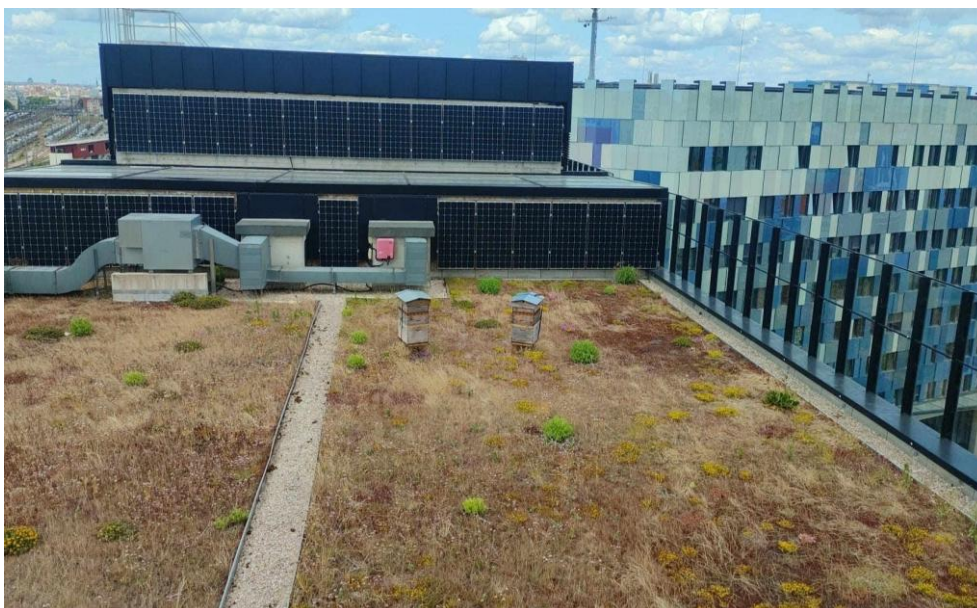
Foto: katusele paigutatud tarud, mis toetavad tolmeldajate populatsiooni ja kohaliku toidu tootmist. Allikas: Alveole

( https://myhive.alveole.buzz/confederation-nationale-credit-mutuel )