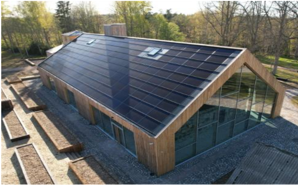
Foto: Solarstone'i päikesekatus.