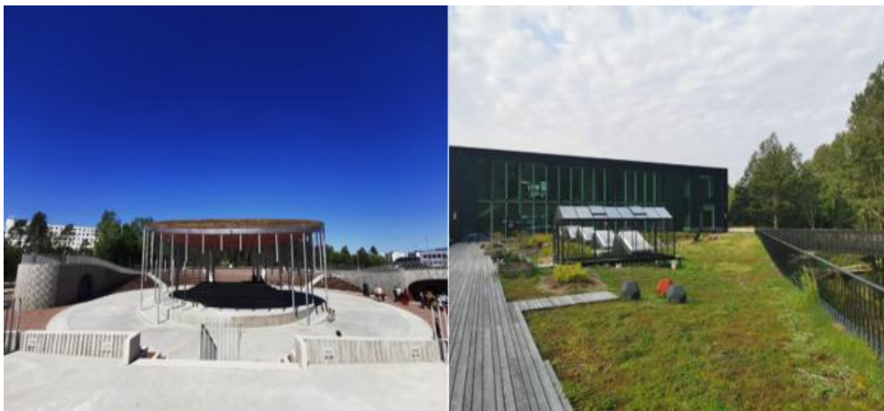
Fotod: vasakul Keila laululava haljaskatus (kukeharjamatt), paremal Viimsi Artium.

Näitajad: paigaldatud haljaskatuste arv, haljaskatuste kogupindala (m 2 ).