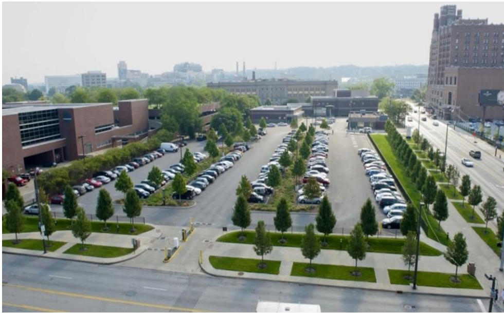
Foto: roheparkla läbilaskva teekattega, et parandada sademevee juhtimist.