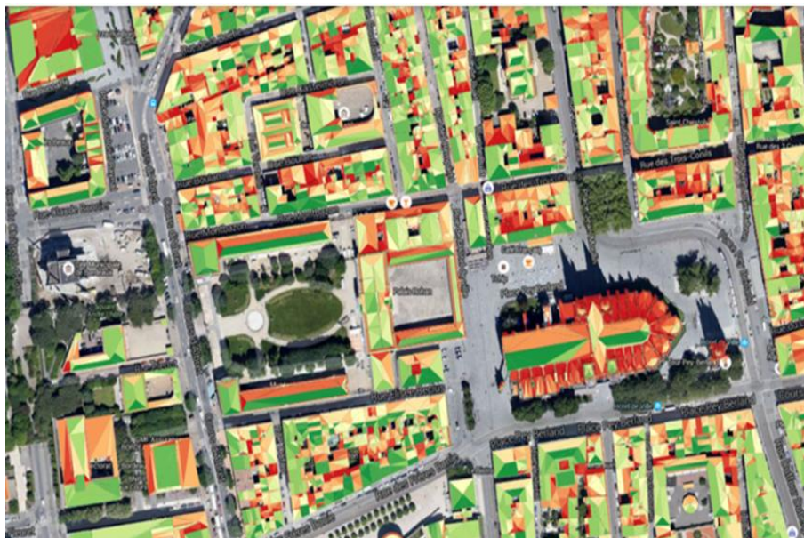
Foto: osa Bordeaux' linna päikeseenergia katastrist.

Lisateave: https://www.cythelia.fr/en/renewable-energies/expertise/solar-cadastre/