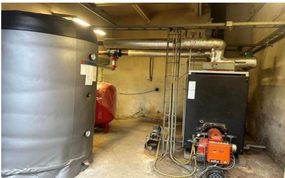
Foto: Roosna-Alliku maasoojusenergia katsejaam.

Näitajad: maasoojusenergia kasutamine (jah/ei), maasoojuskütte osakaal soojusbilansis.