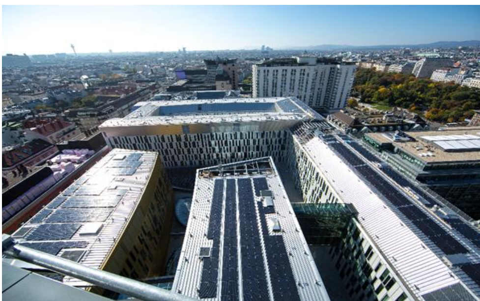
Foto: Viini päikesepaneelidega elamute katused.