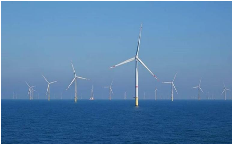
Foto: avamere tuulepark.

Näitajad: paigaldatud võimsus (GW), elektrienergia kogutoodang (TWh)