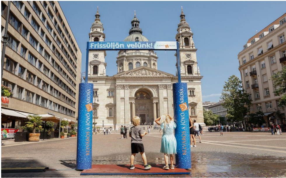
Foto: avaliku ruumi jahutusjaam (veeuduvärv), mis pakub jahutust kuumalainete ajal.