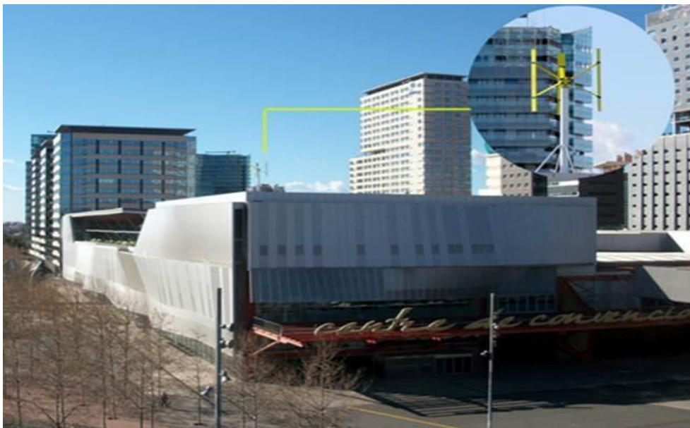
Foto: vertikaalne tuuleturbiin Barcelonas.

Näitajad: paigaldatud vertikaalturbiini võimsus (kW), aastane elektrienergia kogutoodang (MWh).