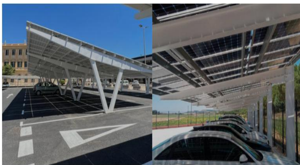
Foto: näide päikesepaneeliga autovarjualuse kohta Hispaanias.

Näitajad: paigaldatud päikesepaneelidega varjualuste arv ja võimsus (kW).