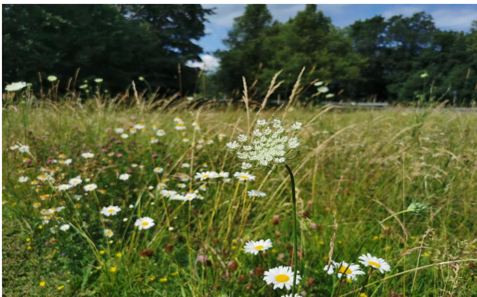
Foto: elurikkuse kaitseala Tori vallas (Jõesuu).

Näitajad: elurikkust soodustavate põhimõtete järgi hooldatud haljasalade arv.