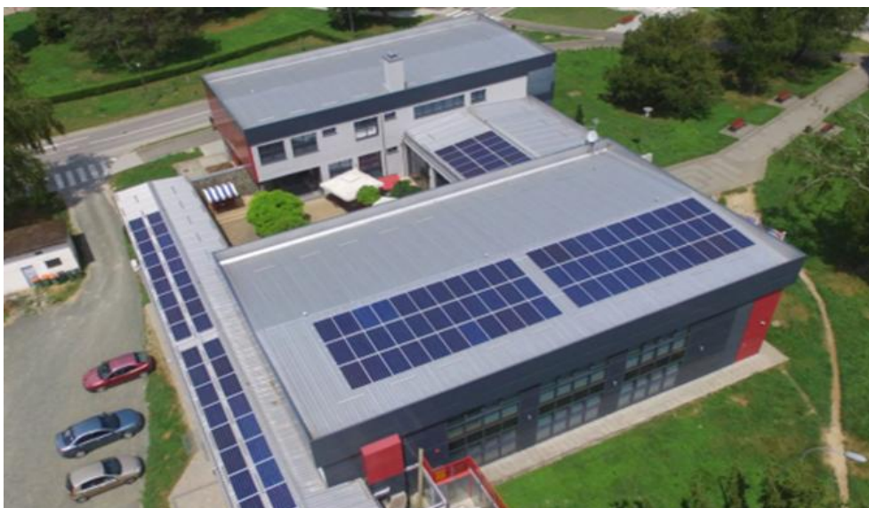
Foto: kogukonna päikesepark kohaliku omavalitsuse hoone katusel Horvaatias.