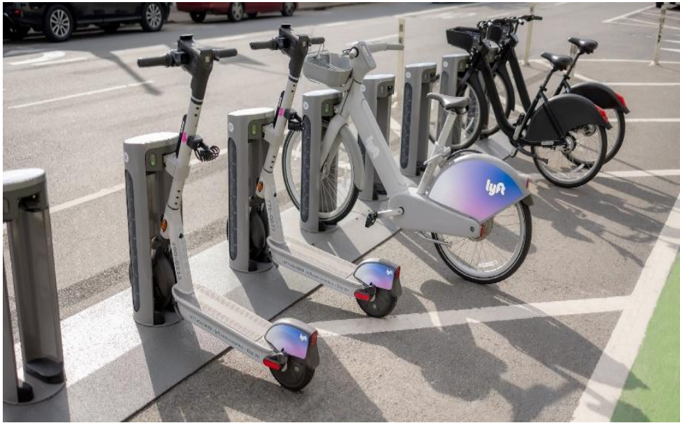
Foto: ühine kergliikurite jaam, kus on elektritõukerattad ja -jalgrattad. Allikas: Lyft

( https://images.ctfassets.net/vz6nkkbc6q75/2aFLGIZExXaUvxaUHWZC1/f86e5d2bc7e962a82ac16773fb3f827b/20221117_Lyft_TBS_Hardware-0154-Edit.jpg?h=1000 )