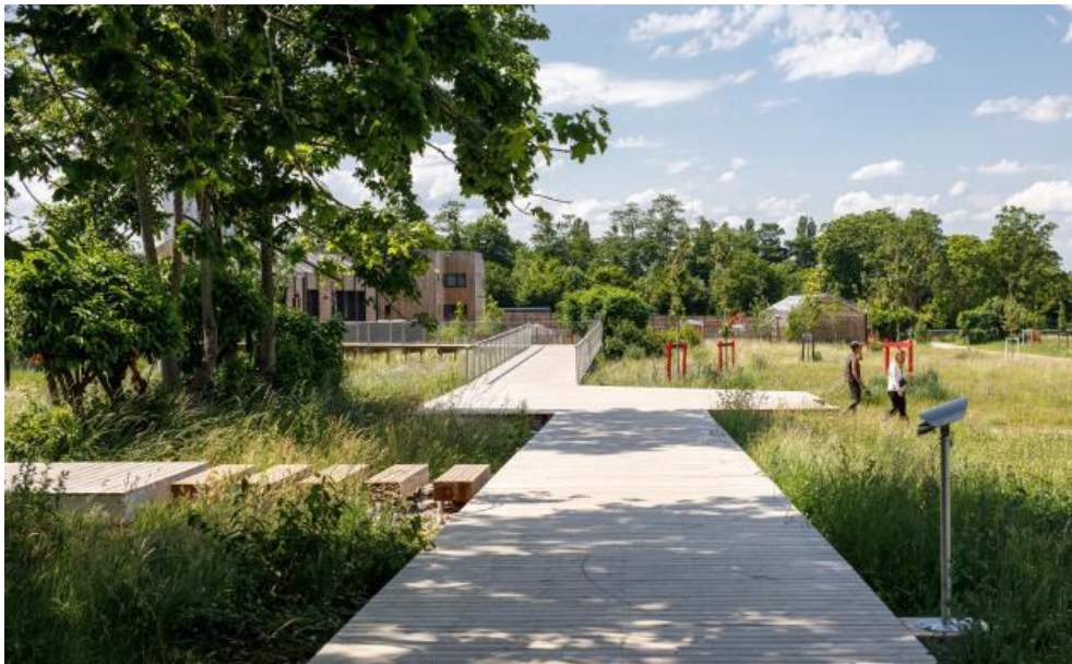
Foto: alakasutatud prügilä ümberehitamine mitmeotstarbeliseks kogukonnapargiks.

Näitajad: pruunaladest loodud haljasalade pindala (m 2 ), kaasatud osalejate arv, elurikkuse näitajad (nt taimeliikide arv, putukate elupaigad).