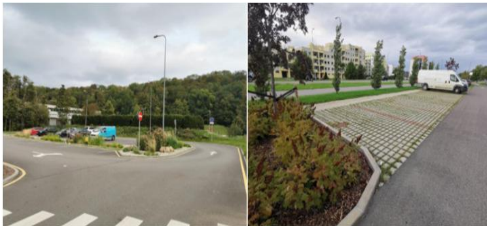
Fotod: roheparkla Viimsis.

Näitajad: rajatud roheparklate arv ja pindala (m 2 ).