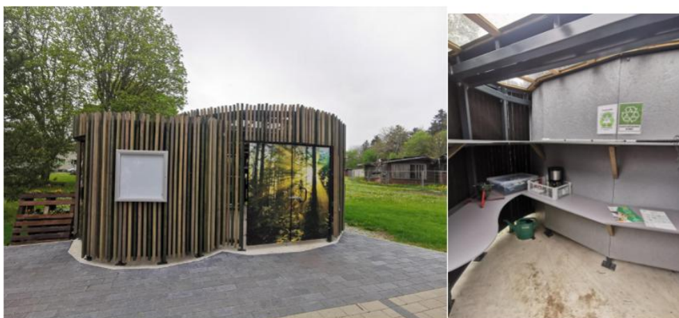
Fotod: Tõdva kogukonna taaskasutuspunkt.

Näitajad: taaskasutuspunktide arv, taaskasutatavate esemete kogus (tk või kg), küllastajate arv.